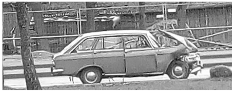
Susidūrimas įvyko prie Anykščių autobusų stoties.

Prieš kelis dešimtmečius gamintas tarybinis automobilis