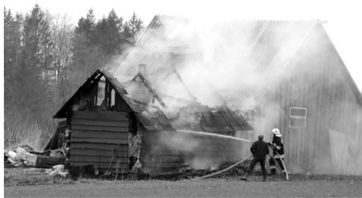
Gaisro metu nudegė pastato stogas ir perdengimas, stipriai apdegė sienos.

Išnaudojus visą vandenį iš automobilio vandens rezervuaro, Kavarsko gaisrinės automobilis vyko prie Budrių ežero, prisipildė vandens, vėl grįžo į įvykio vietą ir gesino ugnį tol, kol gaisras buvo visiškai lokalizuotas.